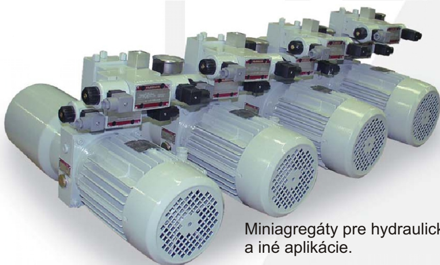
Miniagregáty pre hydraulické plošiny a iné aplikácie.