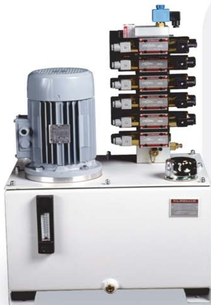
Riešenie so zvaranou nádržou.

Menšie hydraulické agregáty sú zostavené zo štandardizovaných komponentov. Ich modulárna konštrukcia nám dovoľuje rýchlu a nákladovo efektívnu výrobu so širokou škálou riešení. Sme tak schopní uspokojiť najnáročnejšie potreby našich zákazníkov.